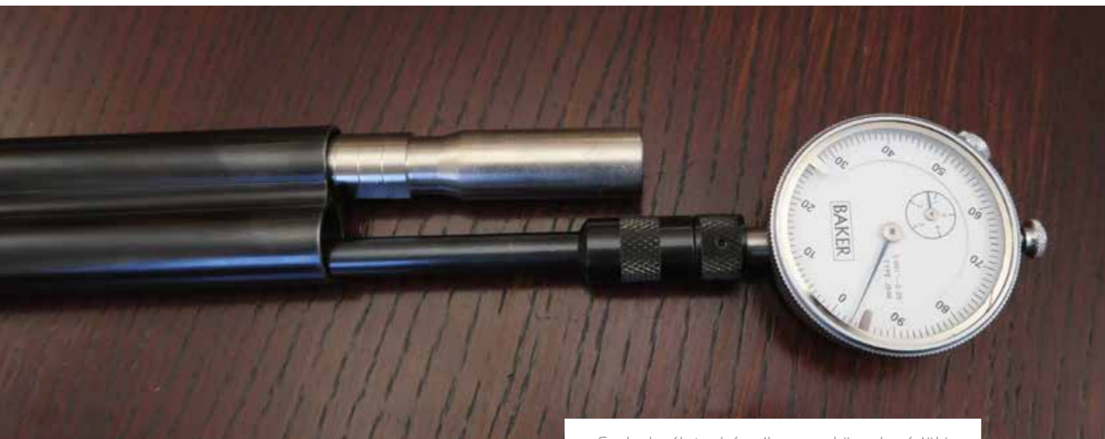
Csak elmélet – bármilyen eszközzel mérjük!

Minden egyéb – például 3/8 vagy 4/10 –, e logika alapján számítva, azok további finomítása. A gyárak általában a csőfaron levő jelzéseikkel megadják ezeket az elméleti (!) értékeket. Azért csak elméleti, mert különféle patronokkal ugyanaz a puska különböző eredményeket produkálhat. Ma – általánosságban – a puskagyártói költségvetésbe nem fér bele a szórás gyakorlati tesztje. Nem úgy néhány kisipari cégnél, pél-